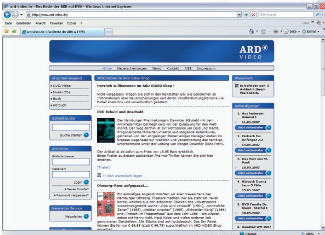
Beispiel: Startseite von ard-video.de